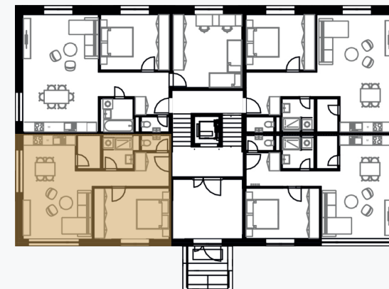
schéma pôdorysu prízemie